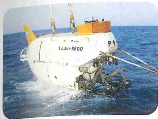
le sous-marin Shinkai 6500